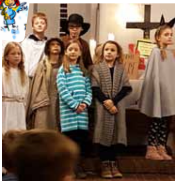
Krippenspiel (siehe Seite 12)