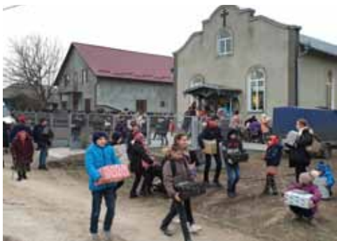
Moldawien, Januar 2020, Vielen Dank den SpenderInnen der Päckchen! (siehe Bericht von M. Dirlam im Internet!)