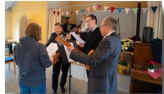
Einsingen des Kahlgrund-Kollegiums