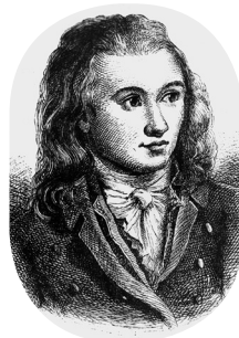
Der Dichter Novalis, eigentlich Friedrich Freiherr von Harden- berg (1772–1801)