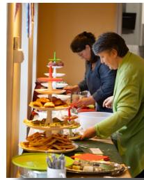
Buffet Berei- tung