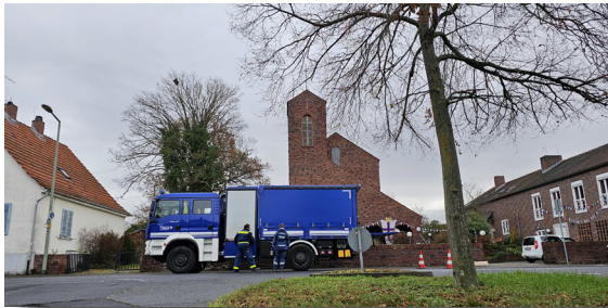
Einheizen durch das THW Alzenau