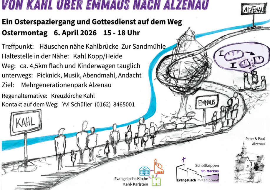
Zeichnung: Matthias Hoffmann

Kontakt auf dem Weg: Yvi Schüller (0162) 8465001