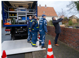
Herzlichen Dank allen Spendern und Helfern!