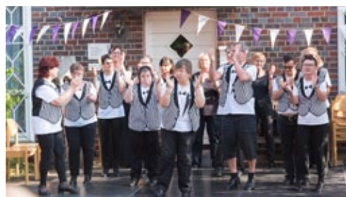
Steptanz von den Including Steps, Aschaffenburg