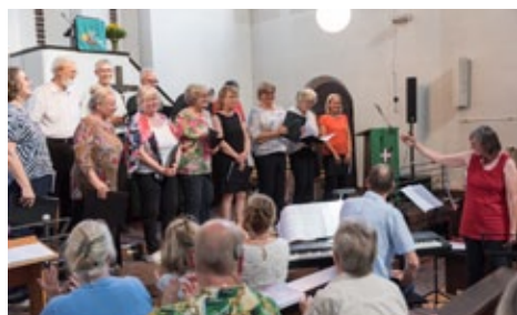
Kirchenchor der evang. Kirchengemeinde Alzenau