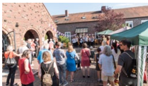
Gute Stimmung vor der Kreuzkirche