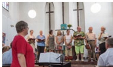
VocalTotal ev. Kirchenchor Kahl-Karlstein