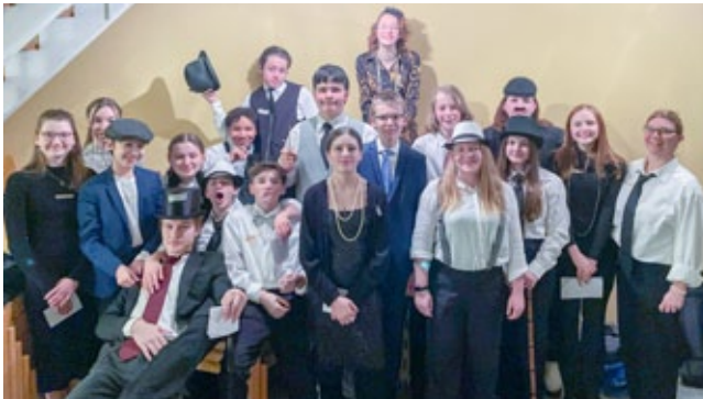
Teamerkurs-Übernachtung mit Krimi-Dinner, 3. Februar 2023