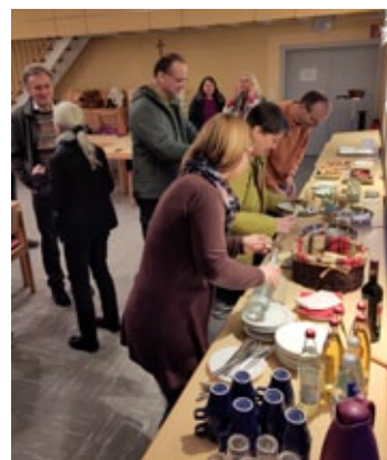
6.4. Feier-Abendmahl am Gründonnerstag in Kahl