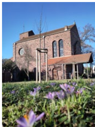
13.2. Bäume frisch gepflanzt