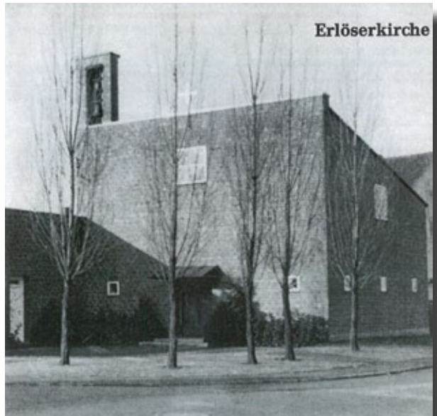
Foto aus dem Buch „Die Kirchen in Dettingen am Main“ der Interessengemeinschaft für Heimatgeschichte, 1973