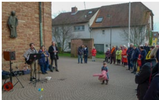
22.2. Ökumenisches Friedensgebet St. Margareta Kahl