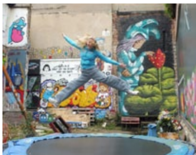
Secret Art Gallery