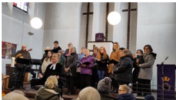
2.4. Der Gospelchor der Paul-Gerhardt-Schule (PGS) Kahl gestaltet den Gottesdienst am Palmsonntag