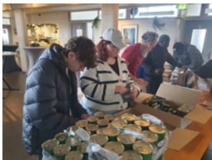
Helfen bei der Diakonie