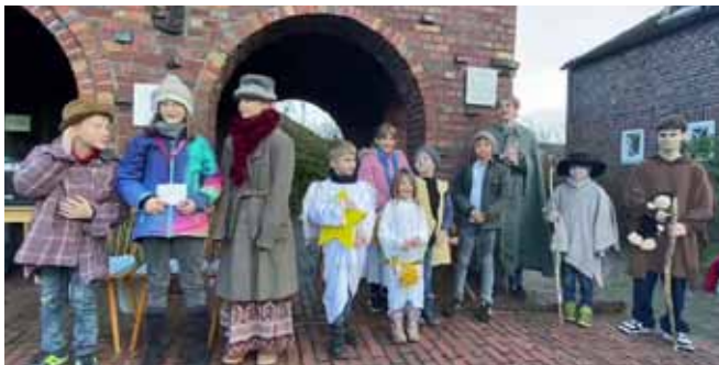
24.12. Krippenspiel Kreuzkirche