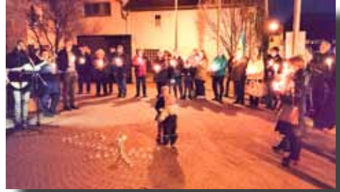
21.12. Friedensgebet für die Ukraine vor der kath. Kirche St. Margareta