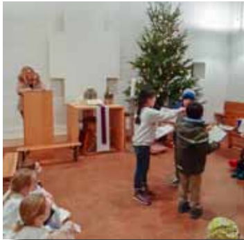
Krippenspiel Proben Karlstein