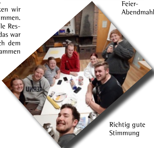
Richtig gute Stimmung