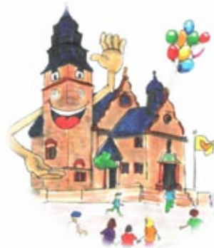
Grafik: Mareike Ahrends