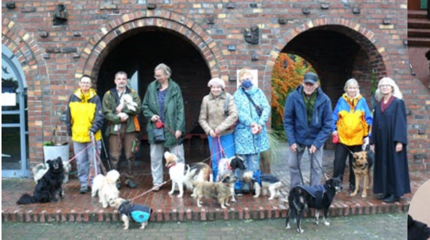
Gottesdienst für Mensch und Tier 25.9.2022