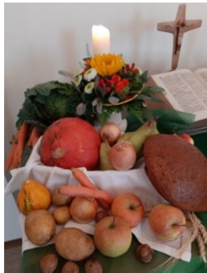
Erntedank in der Alten Schule, 1.10.2022