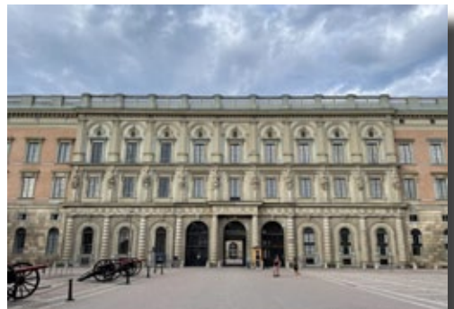
Schloss in Stockholm