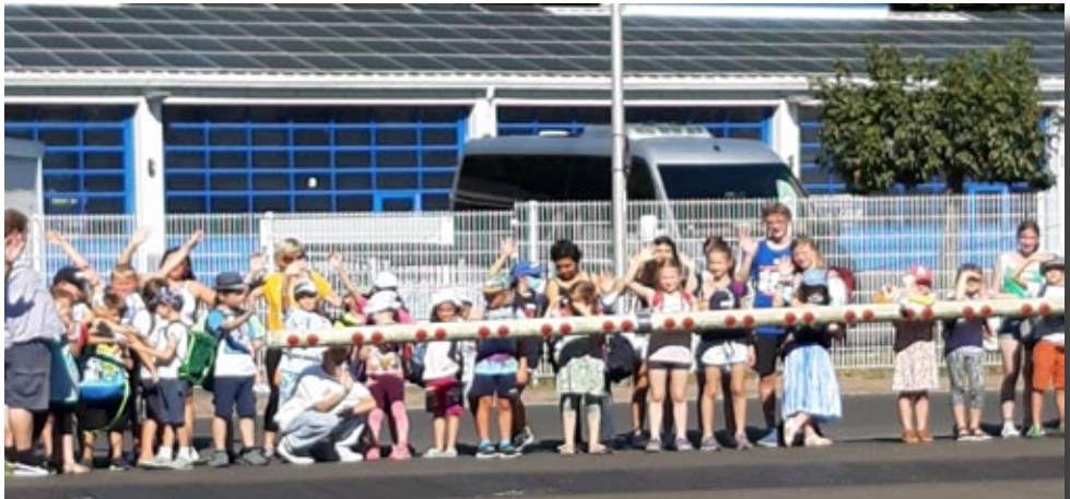
Ausflug zur Bahnwerkstatt nach Schöllkrippen