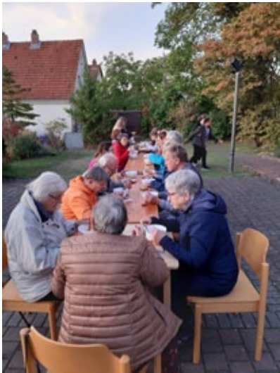
Eintopf vor der Kreuzkirche, 5.10.2022