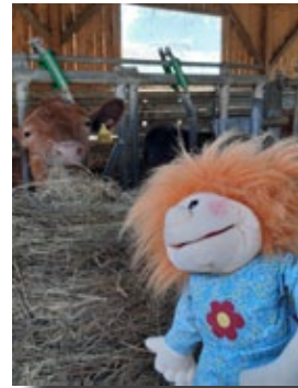
Maskottchen Lucy auf dem Bauernhof