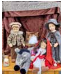
24.12.2021: Die Krippe bei Mini-Gottesdienst Heiligabend.